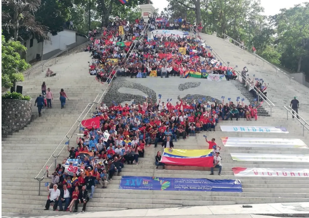
Protesto contra o imperialismo estadunidense durante o 25º Encontro do Foro de São Paulo, ocorrido em Caracas (Venezuela), de 24 a 28 de julho de 2019

e ideológicas. Obviamente, como em qualquer organização formada por integrantes com liberdade de manifestação e opinião, é comum que as lideranças partidárias sejam críticas até em relação ao próprio FSP, e evidenciem seus limites e insuficiências (Alarcón; Melo, 2023, p. 139).