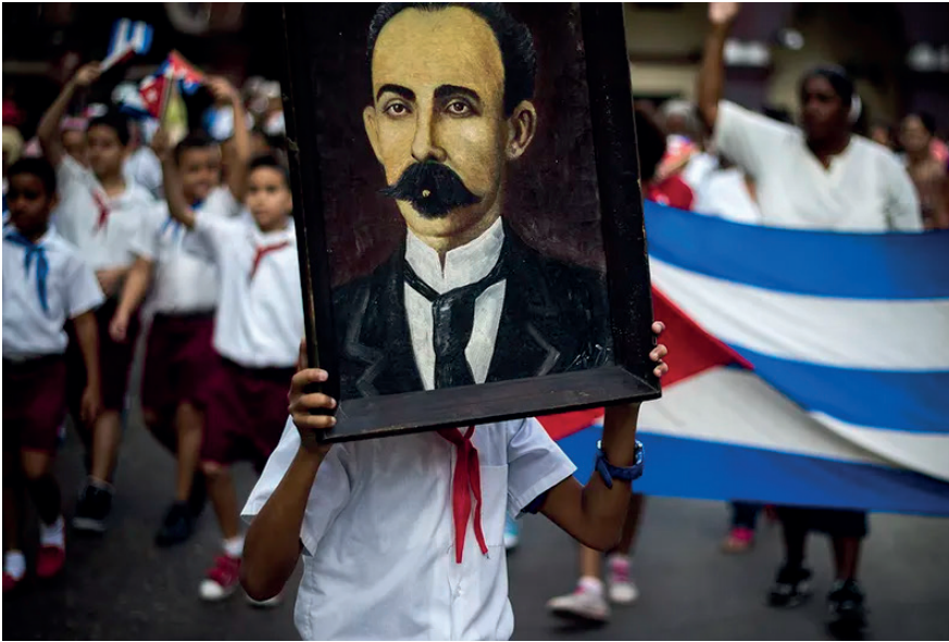
Estudante carrega cartaz com retrato de José Martí, herói nacional cubano (1853-1895), durante desfile em Havana

“unidade e luta” 11 . Levando em conta objetivos históricos de longo prazo, objetivos intermediários e objetivos mais políticos, tais valores e preceitos são: