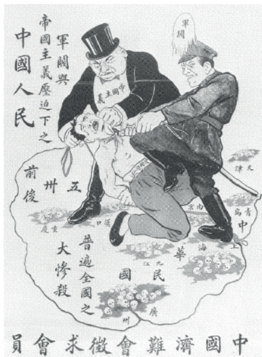
Propaganda retrata um ocidental e um senhor da guerra chinês torturando manifestante durante o massacre de 30 de Maio, violenta repressão contra trabalhadores e estudantes chineses em Xangai

Uma resposta satisfatória demanda um breve desvio para tratar da estratégia militar de Mao 31 . De maneira sintética e esquemática (e até um tanto imprecisa), a guerra popular maoista segue o seguinte protocolo de quatro etapas, que se sucedem numa espiral crescente: