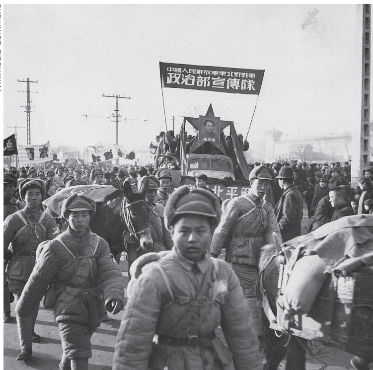
Comemoração da vitória da Revolução Chinesa em Pequim, 1949

Dedicamos as próximas páginas para tentar demonstrar como se deu o acontecimento responsável pela libertação da China.