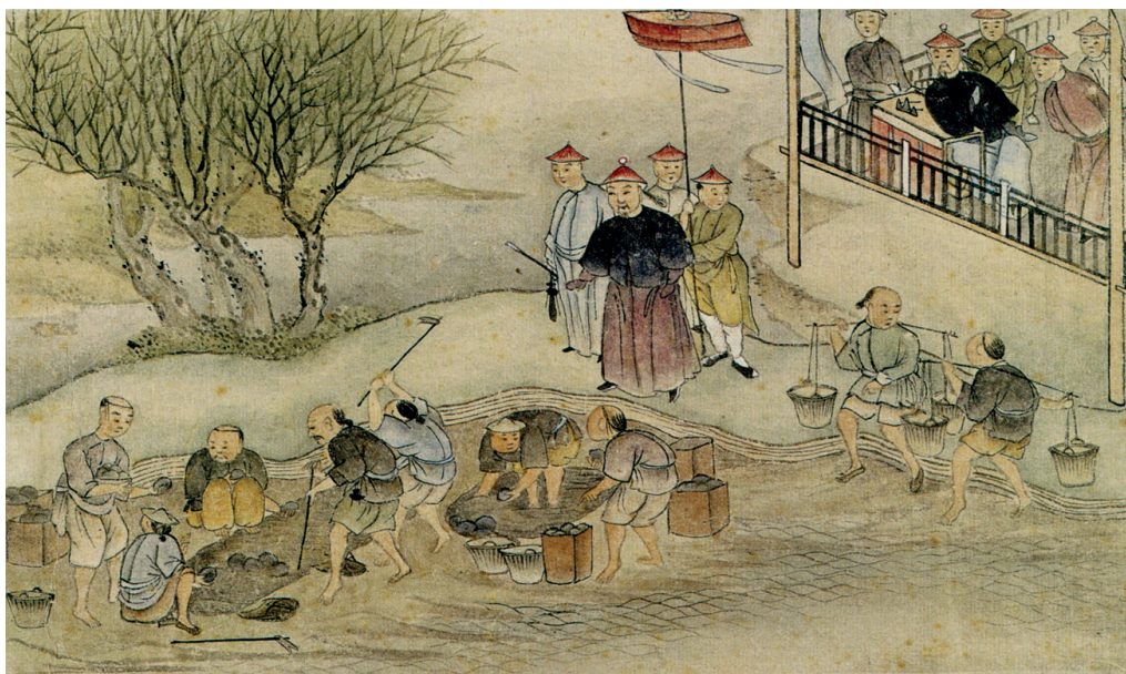
Autoridades chinesas de Cantão supervisionam destruição de ópio britânico importado da Índia. Gravura de 1839

1976b, p. 57-58, tradução nossa). Como alguém que quer ir ao norte mas pega um trem para o sul, tudo o que um governo estruturado pelo MPT podia fazer era tentar se libertar oprimindo ainda mais a única força capaz de sustentar essa liberdade 21 .