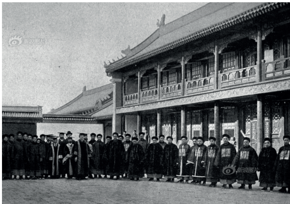
Universidade de Pequim, 1901