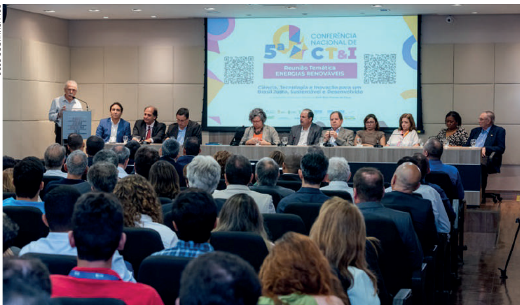
Debate sobre energias renováveis durante reunião temática da 5ª Conferência Nacional de Ciência, Tecnologia e Inovação, realizada na sede da Federação das Indústrias do Estado do Ceará. Fortaleza, fevereiro de 2024

Para orientar a atuação institucional da Finep e do CNPq, bem como das demais agências, empresas, órgãos e unidades vinculados ao MCTI, o ministério formulou as diretrizes da nova Estratégia Nacional de Ciência e Tecnologia e Inovação, que retomaram e atualizaram os quatro eixos que já haviam estruturado essa estratégia no primeiro governo Lula: