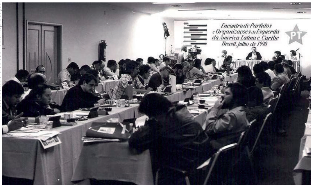
Seminário internacional, organizado pelo PT em julho de 1990 na capital paulista, que deu origem ao Foro de São Paulo

social; b) a perda dos direitos adquiridos, que constituíam patrimônio popular; c) os níveis de repressão e a criminalização do protesto legítimo; d) o desgaste das forças de direita que estiveram à frente do programa neoliberal dos anos 1990; e) a acumulação política e eleitoral da esquerda; f) a força dos movimentos sociais; g) a emergência de atores já existentes no contexto, mas que elevaram sua condição subjetiva, tornando-se sujeitos políticos, atuando para promover as transformações.