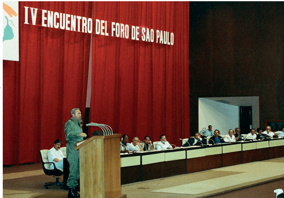
Fidel Castro, no encerramento do IV Encontro do FSP em Havana (Cuba), 1993

A atuação do FSP tem sido importante nesse campo, tanto pela construção teórica quanto pela dinamização da ação de sujeitos políticos enraizados no povo a partir das formulações de seus partidos integrantes.