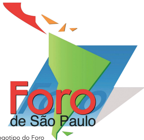
Logotipo do Foro

José Antonio Sanahuja também diferencia dois tipos de “regionalismo latino-americano” e analisa “a crise do ‘regionalismo aberto’, como estratégia de integração regional dominante no período 1990-2005, e a emergência de um novo ciclo caracterizado pelo chamado ‘regionalismo pós-liberal’, que tenta conformar o espaço sul-americano” (SANAHUJA, 2010, p. 127, tradução nossa). Assim, o “regionalismo pós-liberal” corresponde ao ciclo iniciado em 1998, um “novo ciclo político inaugurado pelos novos governos de esquerda e lideranças regionais que, com estratégias conflitantes, promovem maior autonomia da região no sistema internacional como um todo e, em particular, perante os Estados Unidos” (SANAHUJA, 2010, p. 87, tradução nossa).