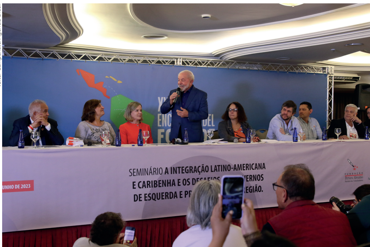
Presidente Lula participa da abertura do XXVI Encontro do Foro de São Paulo. Brasília, 29 de junho de 2023