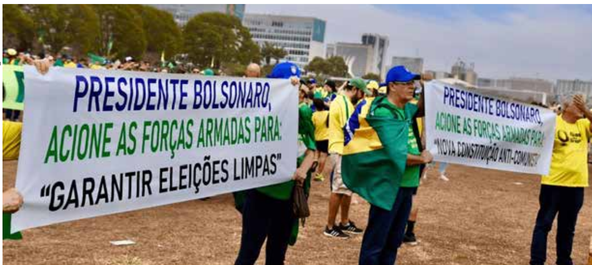
Faixas golpistas em atos pró-Bolsonaro. Brasília (DF), 7 de setembro de 2021

Apesar de não ser sua causa originária, a forma de governar de Bolsonaro amplia a crise na medida em que, por um lado, mina as instituições — sistema político, Supremo Tribunal Federal (STF) etc. —, que já estavam fragilizadas, e, por outro, concede benesses, em troca de apoio, para os militares, tais como tratamento especial no quadro da reforma da Previdência, ampliação do número de cargos ocupados no governo, reestruturação da carreira militar (que implicou aumento salarial nos níveis hierárquicos mais altos) e ampliação dos gastos e investimentos do Ministério da Defesa, mesmo com o teto de gastos.