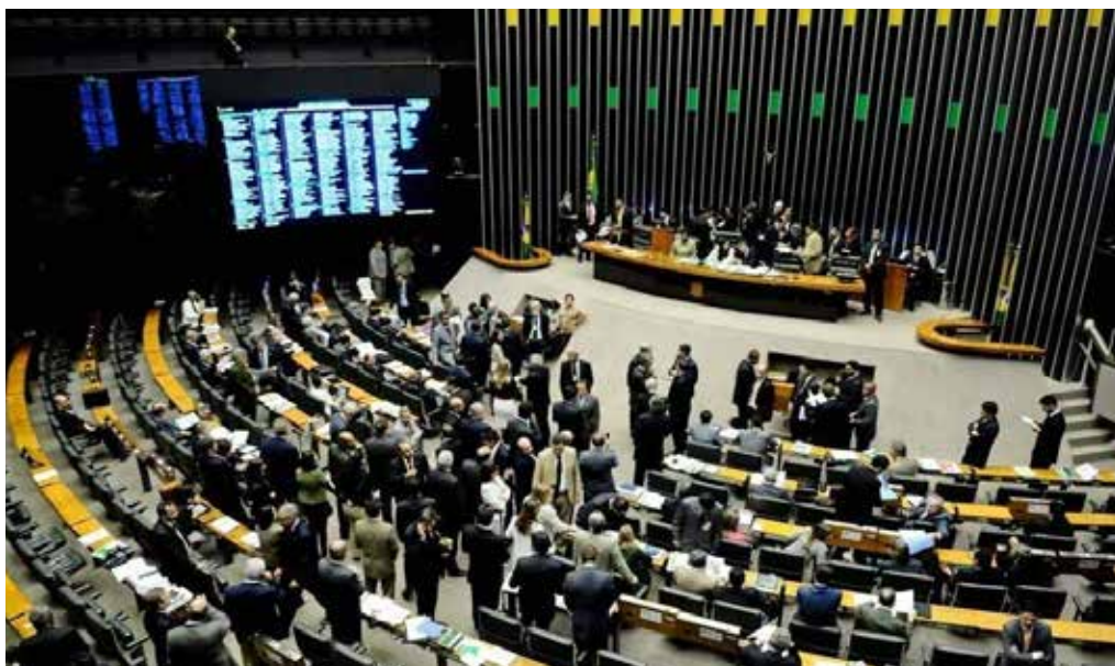
Plenário da Câmara dos Deputados, Brasília (DF), 2022. O chamado Centrão é um dado da realidade política nacional desde a Independência, em 1822

quantos milhões de empregos deverão ser gerados imediatamente . Sairemos do usual, não discutiremos questões relacionadas a macroeconomia; o ambiente está poluído por esse tipo de debate. Vamos às propostas concretas.