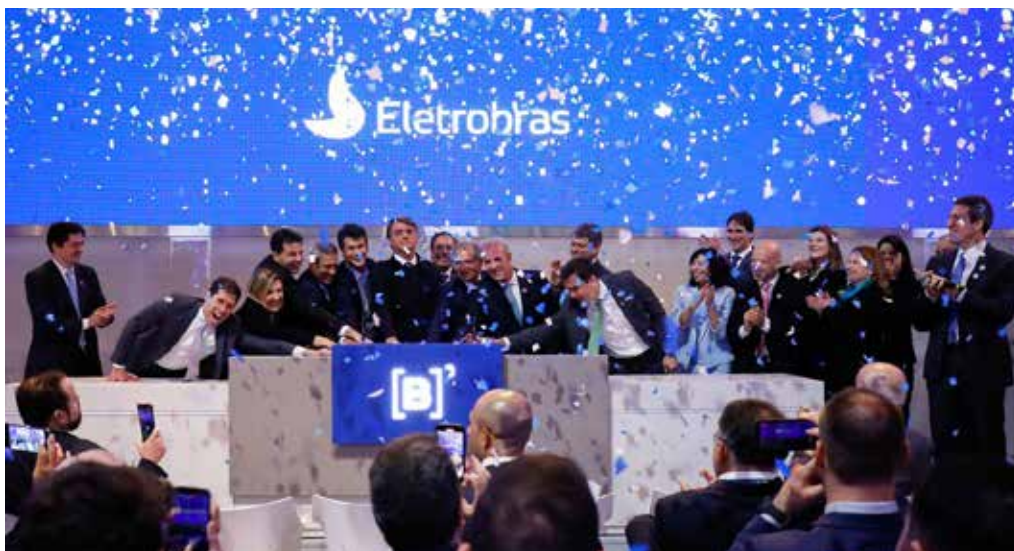
Leilão de privatização da Eletrobras

No que tange à fração da burguesia agropecuária, chama a atenção a trajetória de crescimento das taxas de lucro das 40 maiores empresas do setor (com dados disponíveis) desde 2015, sobretudo em 2020, quando a taxa alcançou o patamar de 21%, muito superior à taxa do setor bancário-financeiro, que foi de 13,5%, sendo as mega e grandes empresas as que obtiveram as maiores taxas de lucro.