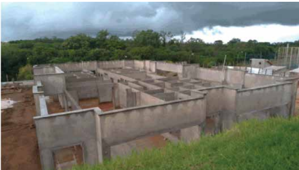
Construção paralisada de creche em Florai (PR), 2021. De acordo com a CGU (Controladoria-Geral da União), a obra era uma das quase 9 mil abandonadas pelo MEC no país

Não podemos nos esquecer. A ponta externa se fecha com o lançamento do programa de infraestruturas (“Reconstruir um mundo melhor”), que pelo menos no papel tenta enfrentar a Iniciativa Cinturão e Rota chinesa. Internamente, o “trilionário” Plano Biden tenta fazer frente às demandas por infraestruturas do país e repor o país em condições de liderar a corrida em tecnologias sensíveis envolvendo comunicações, smart cities , informação e inteligência artificial 10 .